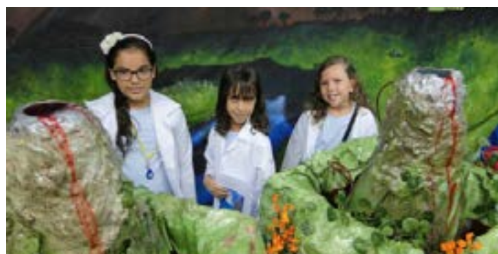
Tema integrador embasou os trabalhos da XIX CIENART

N a XIX CIENART, que aconteceu no dia 06 de novembro, os alunos do Ensino Fundamental I e II apresentaram trabalhos ligados ao tema integrador proposto pela escola em 2015: "Energia que (re)cria e transforma a vida".